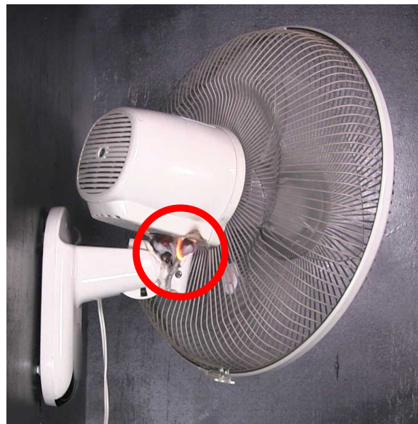
内部部品の経年劣化により発火